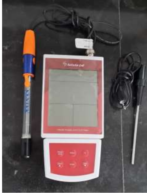
هدایت سنج Testo240