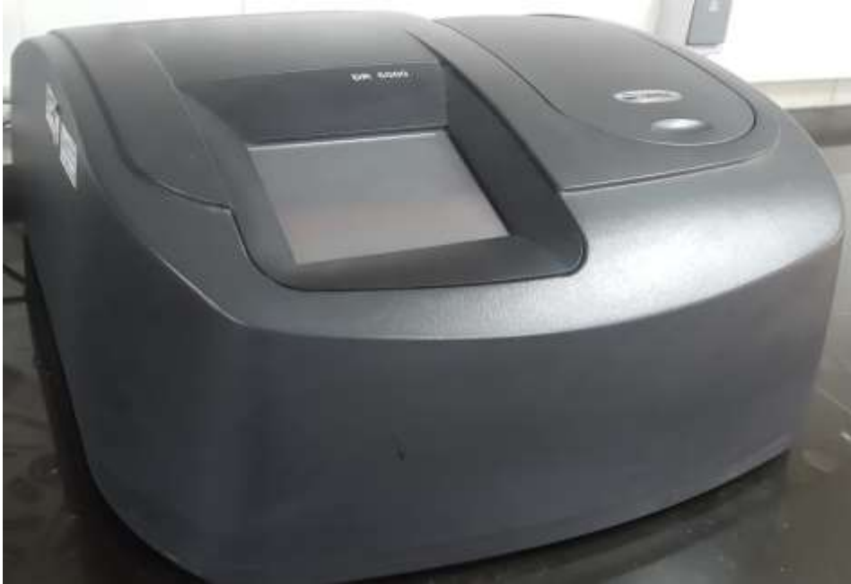
اسپکٹروفتومتر دوپرتویی Perkin Elmer Lambda25