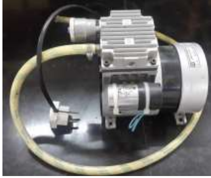
کلنی کانتر Sana SL 902